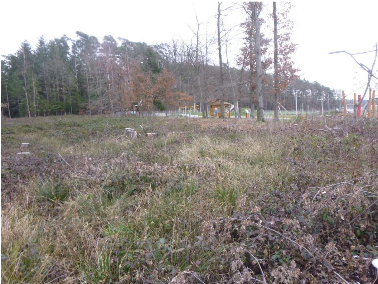
Abbildung 4: Blick über das Plangebiet von Nordwesten nach Südosten. Im Hintergrund ist der Mehrgenerationenspielplatz erkennbar. Die meisten der älteren Bäume stehen auf dem Nachbargrundstück (eigene Aufnahme am 31.01.2023)

Das Landschafts- und Ortsbild im Gemeindegebiet ist weitgehend von offenen und landwirtschaftlich genutzten Flächen sowie angrenzenden Waldflächen geprägt. Der Gemeinde Winkelhaid wurde im Fachbeitrag zur Landschaftsrahmenplanung Bayern (Karte Schutzgut Landschaftsbild, 2013) allgemein eine mittlere landschaftliche Eigenart zugeschrieben. Das Plangebiet selbst ist eine Vorwaldfläche mit einzelnen Überhältern und durch die angrenzenden forst- und landwirtschaftlichen Flächen, Gewerbeflächen im weiteren Umkreis und Lärmmissionen der Autobahn geprägt.