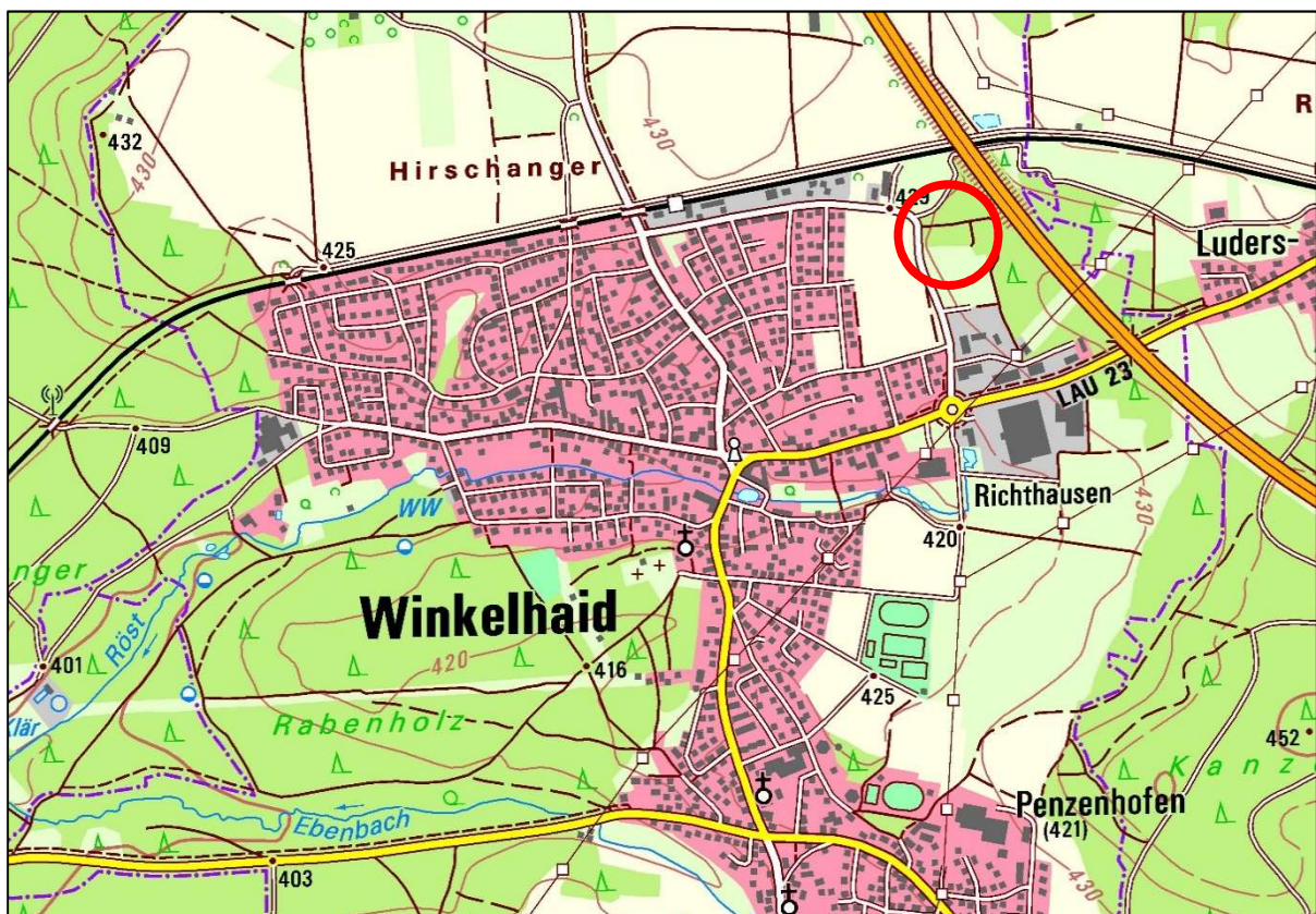
Abbildung 1: Lage im Raum (Kartengrundlage DTK 25, © Bayerische Vermessungsverwaltung 2023) mit Kennzeichnung des Geltungsbereichs