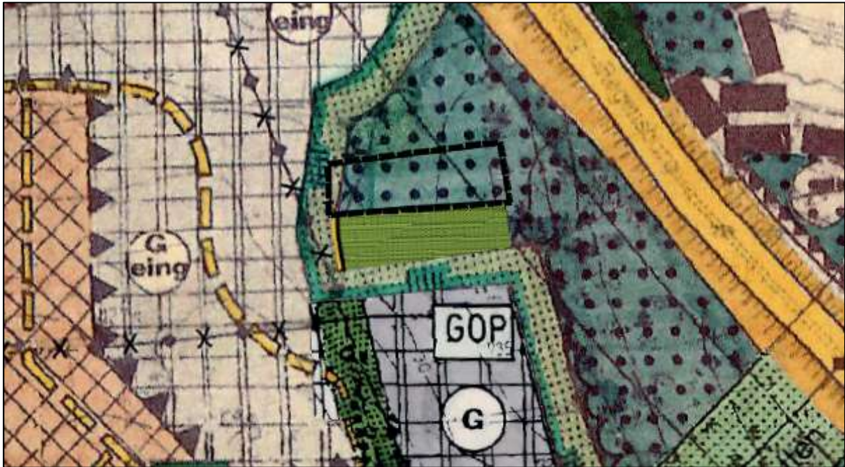
Abbildung 2 Ausschnitt aus dem wirksamen Flächennutzungsplan der Gemeinde Winkelhaid mit Stand der 9. Änderung (Geltungsbereich des Bebauungsplanes Nr. 34 „Gewerbegebiet Mayerhöfen Nord“ ist mit schwarz-gestrichelter Linie gekennzeichnet).

Der Bebauungsplan ist somit nicht aus dem Flächennutzungsplan entwickelt und muss geändert werden. Dies erfolgt im Parallelverfahren gem. § 8 Abs. 3 BauGB über die 10. Änderung des Flächennutzungsplanes.